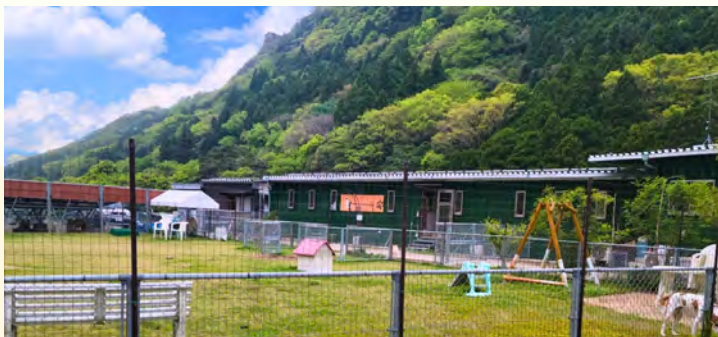
午前・午後に分けお外遊びと夜間20:00頃にトイレをして就寝します。